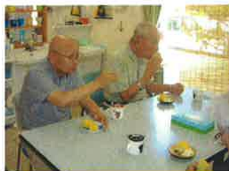
トウモロコシ 美味しいな～