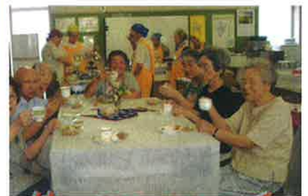
ゆったりすとカフェで あー美味しいコーヒー!