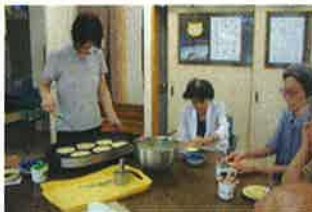
今日のおやつは ホットケーキ