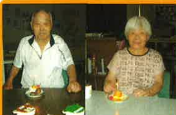
7月は2名の 利用者さんが 誕生日を迎え られました。