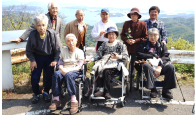
金甲山ヘドライブに!

端午の節句の歌を歌い、みんなでお祝いし、楽しみました。当日とはなりませんでしたが、段ボールの鎧、兜に身を包み、凛々しい姿での写真撮影も、良い記念となりました。