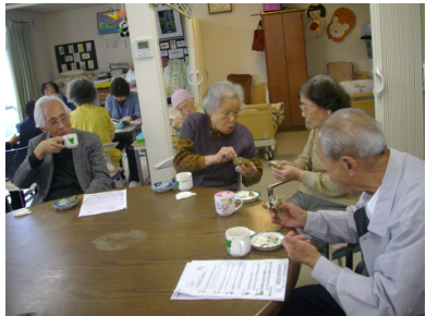
みんなで作った柏餅 美味しいな!