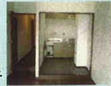
バリアフリー化されていない住宅の例