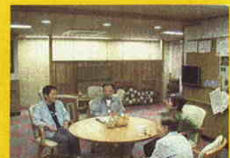
高齢者生活支援施設